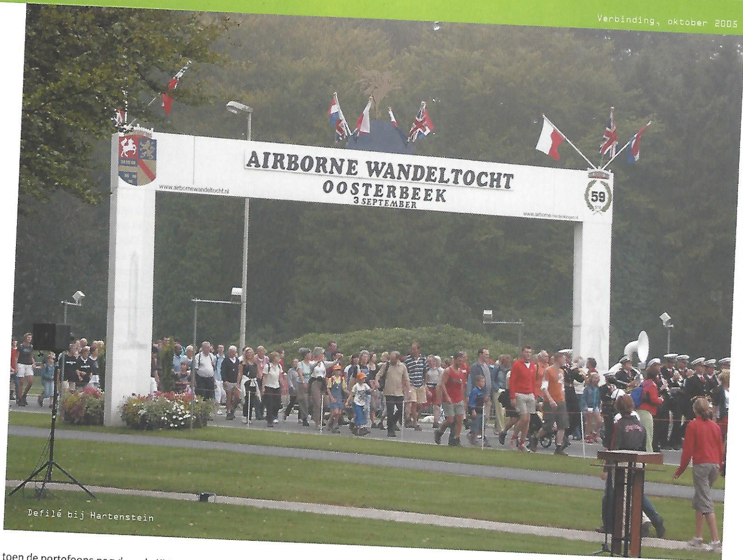
Defilé bij Hartenstein