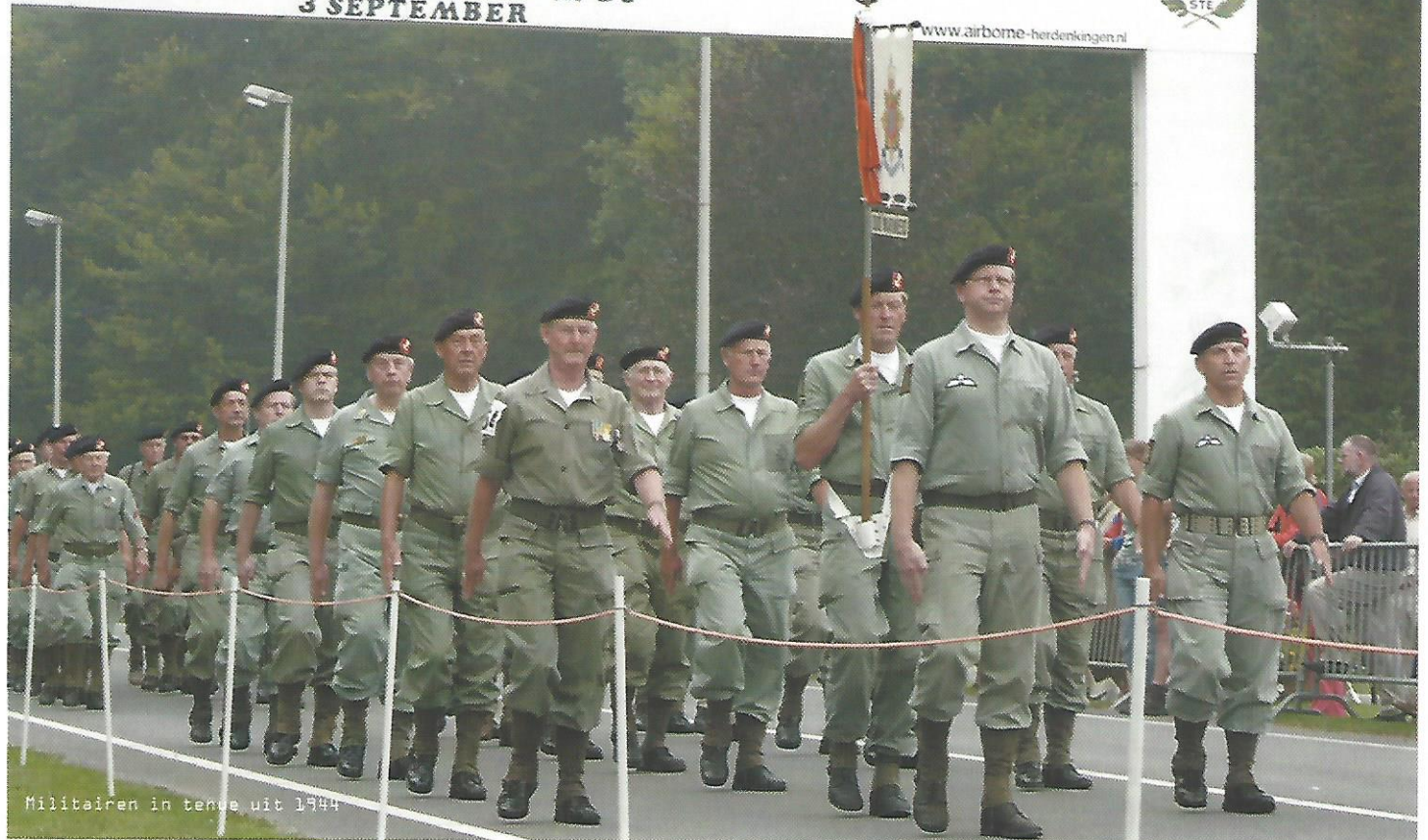
Militairen in tenue uit 1944

zich niet in de gesprekken die wij voeren. Een voordeel van dit systeem is ook dat we bij eventuele calamiteiten tijdens de wandeltocht een aparte gespreksgroep achter de hand hebben waar alle betrokkenen op kunnen worden overgezet.”