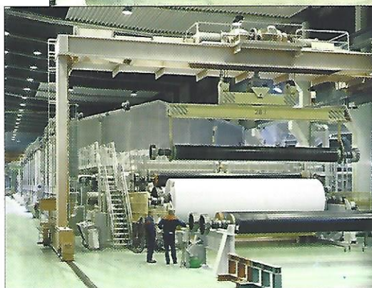
De capaciteit van de productie en de omvang van de drie machines in de fabriek is gigantisch.

papier vooral multifunctioneel is. Behalve de nodige innovaties aan het product, is er inmiddels een iets andere verpakking, een ietwat aangepast logo en is men volop bezig meer variëteit te bieden in gewicht, afmeting en kleurtinten van het papier. Bij de verpakking is zowel gedacht aan de gebruiker als aan de dealer. Voor de gebruiker is het een stuk aangenamer gemaakt om bij-