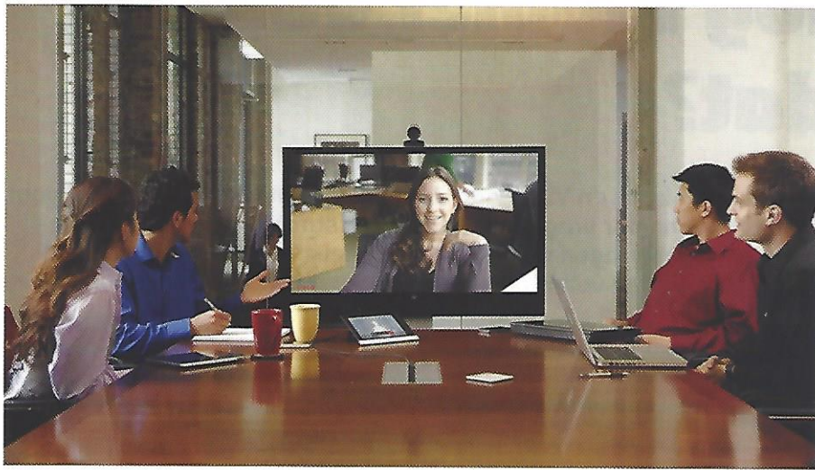
Met een geschikte infrastructuur zijn online meetings eenvoudig op te zetten.