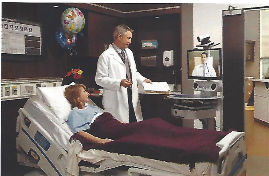
De gebruiker ervaart dat veel dingen efficiënter zijn geworden.